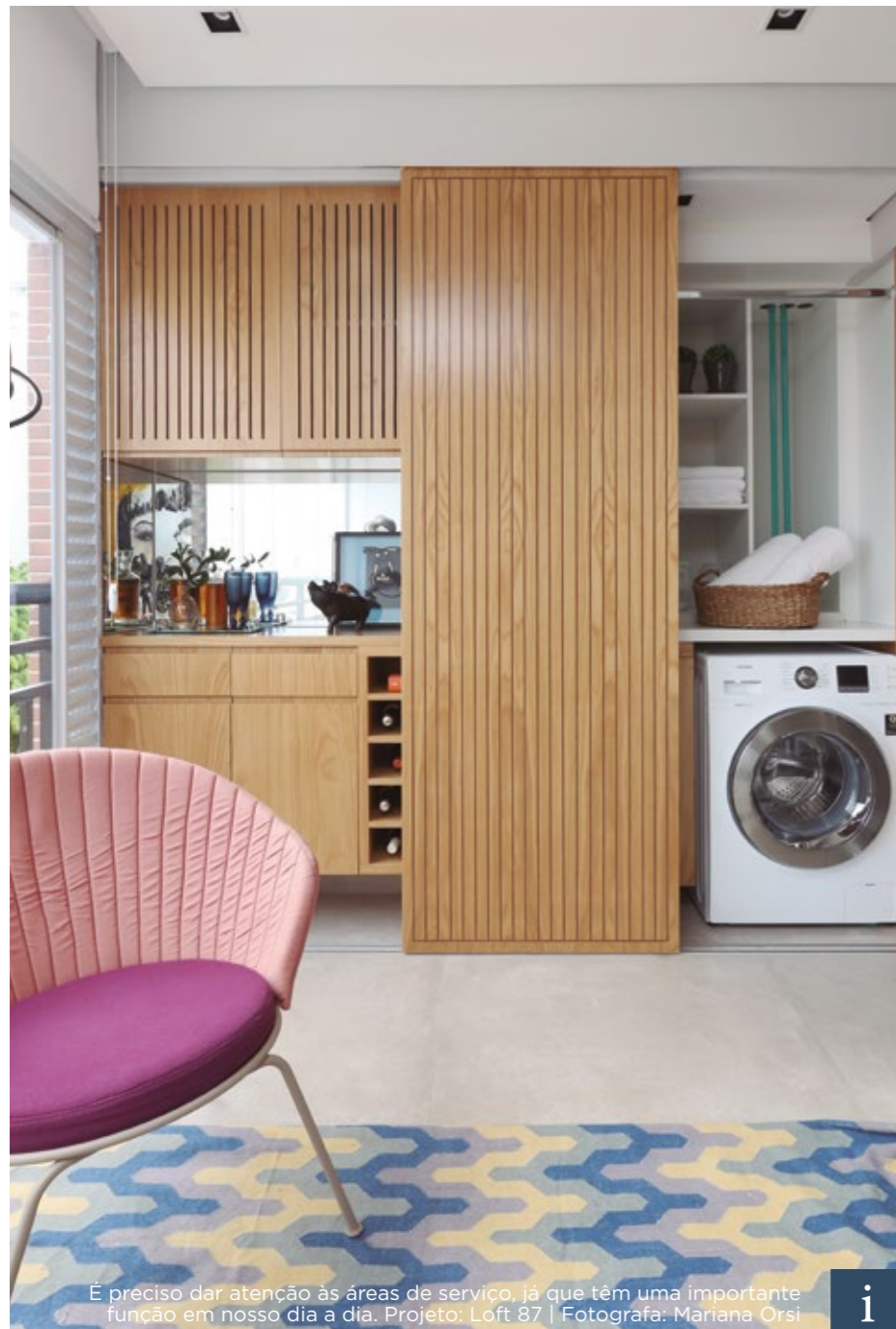
É preciso dar atenção às áreas de serviço, já que têm uma importante função em nosso dia a dia. Projeto: Loft 87